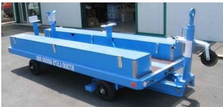
Remorque palonnier et volet interne