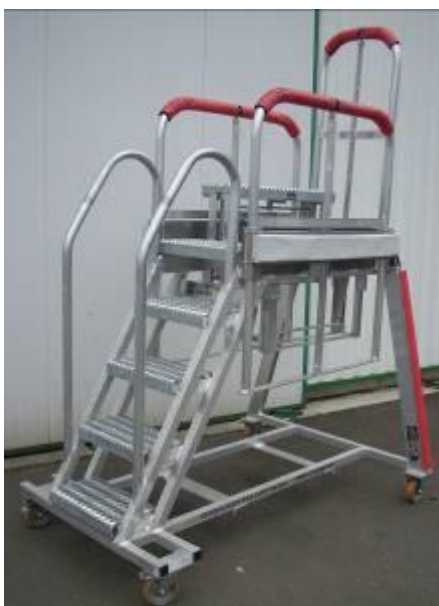
Escabeau d'accès maintenance