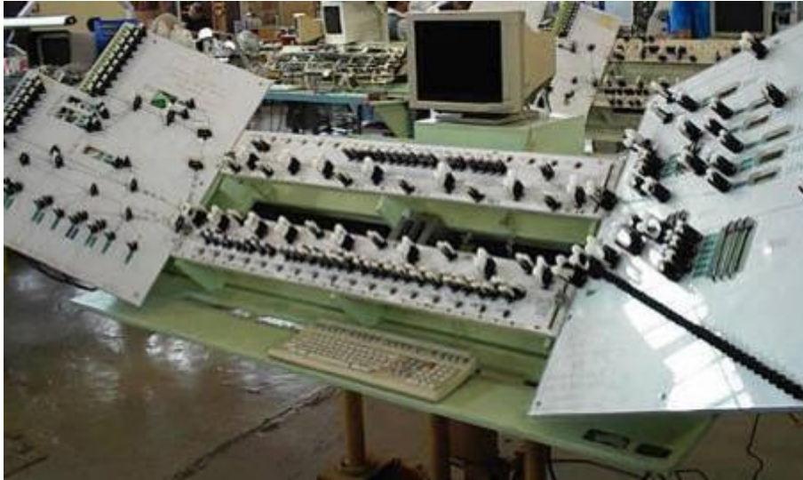
Table de câblage