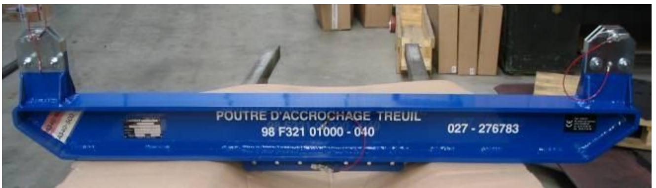
Outillage de levage