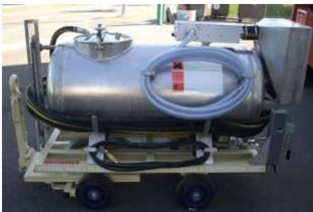
Cuve à dépression ATEX 350L