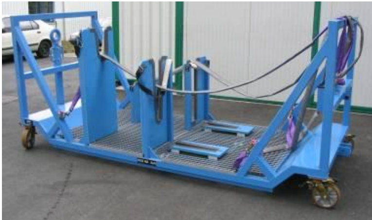
Chariot (Wing Tip Fence)