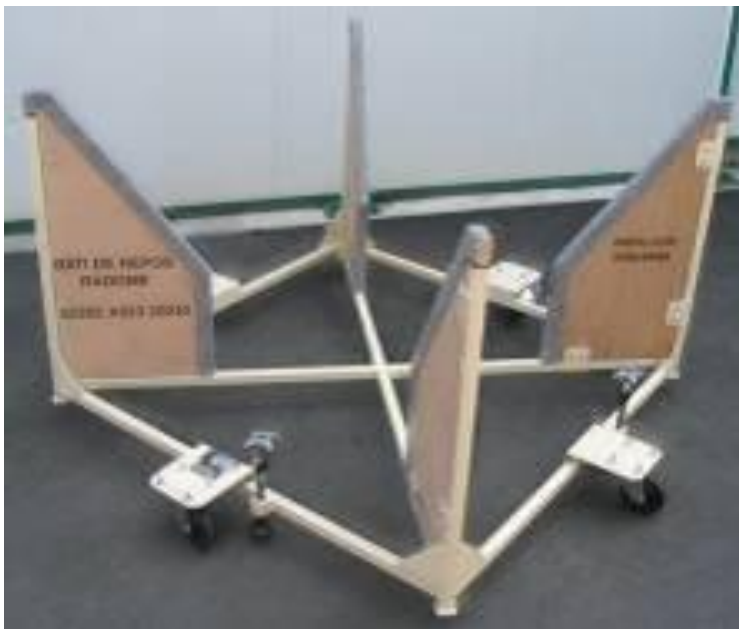
Bâti de repos Radôme (alu / bois)