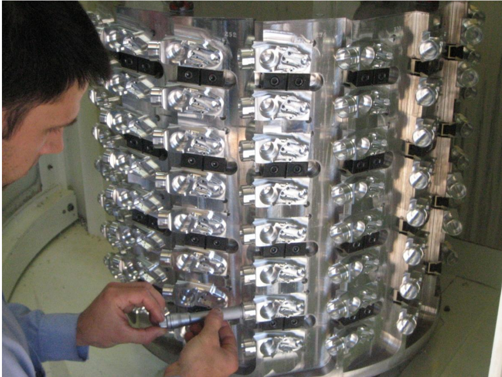
Outillage de fabrication de composants usinés en panoplie